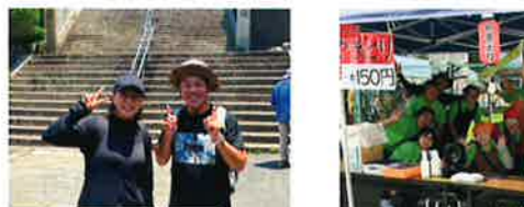
令和7年6月29日 生駒市福祉びと交流会山登り大会