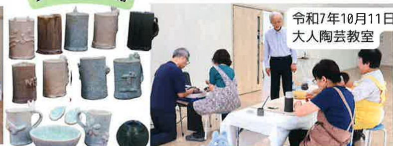
参加者の作品 令和7年10月11日 大人陶芸教室

赤い羽根共同募金様よりご寄贈いただいた陶芸窯を今年度も活用し、陶芸教室を開催することができました。子どもたちはコップ作り。大人はコップに皿に箸置き。電動ろくろ体験もあり思い思いの作品が完成しました。