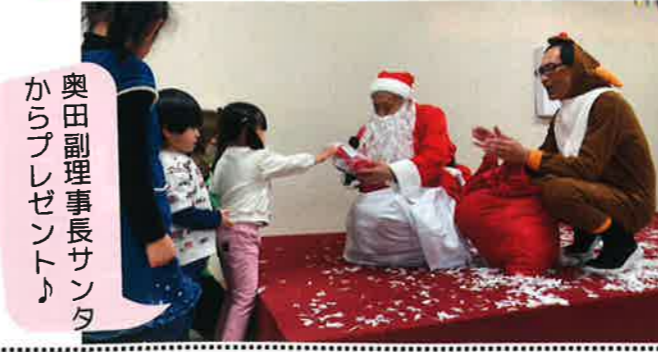
奥田副理事長サンタ からプレゼント♪