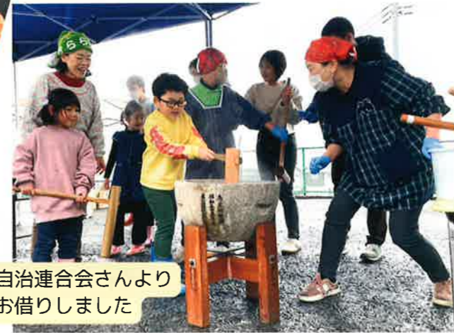
鳥見地区自治連合会さんより 臼と杵をお借りしました

小雨の降る中ではありましたが、みんなでもちつき大会を楽しみました。杵で餅をつくたびに、「よいしょ！よいしょ！」の掛け声で大盛り上がり！会場は笑顔と応援の声に包まれました。なかまともにもちつきを楽しみ、日本の伝統行事に自然と触れることは、とても豊かで大切な経験だと感じました。こうした時間をこれからも大切にしていきたいと思います。