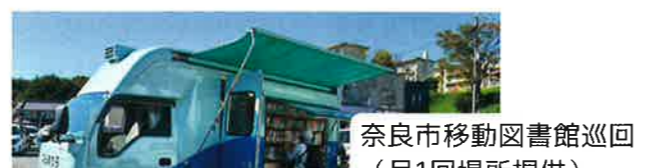
奈良市移動図書館巡回 (月1回場所提供)