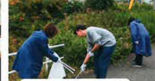
令和6年11月16日 鳥見クリーン大作戦