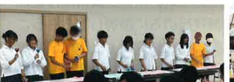
令和7年10月7日 富雄中学校ボランティア部交流会