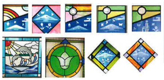
ドアにデザイン変えて「きららの木」

この作品は展示品のなかで一目惚れし、ぜひにいただいた。後に由来を聞くと、JR福知山線脱線事故テレビ報道で白百合の花の献花が映り枯れていたこと。百合が枯れることなく、いつもきれいに咲いているようにと想いを込めて。