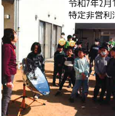
令和7年2月15日 特定非営利活動法人サークルおてんとさん様

温暖化防止を目的に、年に一度、勉強会を実施 しています。 マンモス君と地球君が出てくるペープサートを見たり、食品ロス、フードマイレージ、断熱について学んだり、食べ物の旬当てゲームをしたり、子どもたちと一緒に地球の未来を考えました。ソーラークッカーでポップコーンと目玉焼きを作り試食しました。