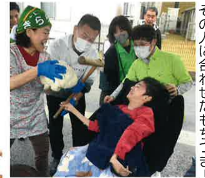
その人に合わせたもちつき！