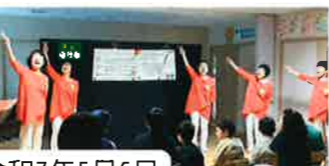
令和7年5月6日 泉のたまご様 おはなし会