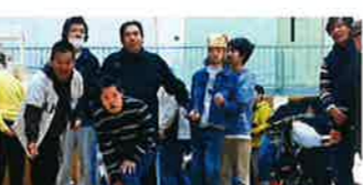
令和7年11月7日 I-Netスポーツ大会 (ポッチャ)