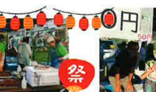
令和7年8月2日 三碓夏まつり