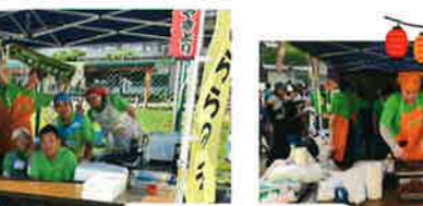
令和7年7月19日 鳥見ふるさと夏まつり