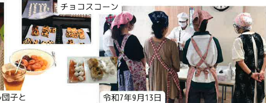
カラフル団子と アイスオレンジティー