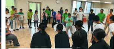
令和6年10月17日 奈良育英中学校実践交流会