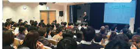
まほろばあいサポーター研修 (通年)