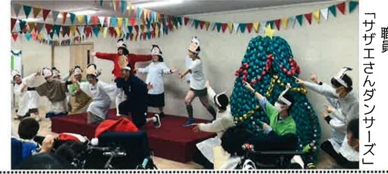
職員 「サザエさん」ダンス