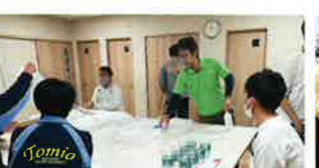
令和7年11月5.6.7日 富雄中学校職場体験