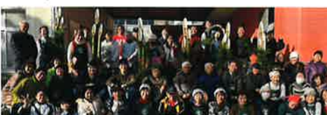
令和7年12月27日 門松づくり (鳥見地区共同開催)