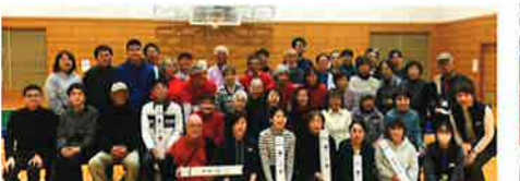
令和7年2月15日 第1回西部南ブロック杯 「ポッチャ大会」