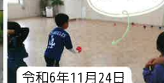
令和6年11月24日 鳥見放課後子ども教室 「ポッチャ大会」