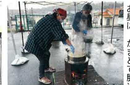
お昼は、かまどで豚汁