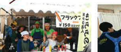
令和7年11月1日 いこままつり