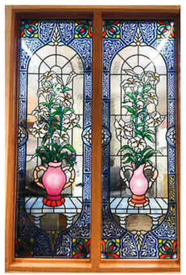
永遠の華(とわのはな) 「玄関本部」

一階の「瑞い美」から二階の「日向」へと続く。下に花が咲き、木の枝が上に上へと伸びていつに。子どもたちが健やかに育つようにとの想い。