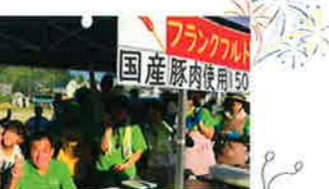
令和7年8月2日 三碓夏まつり