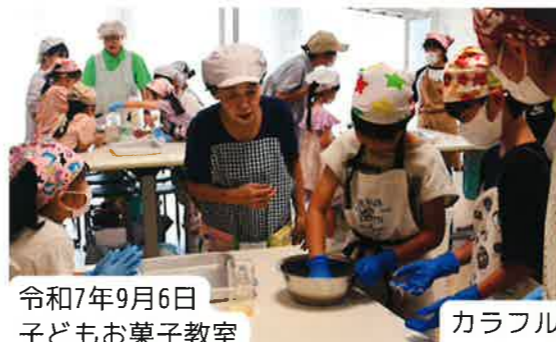
令和7年9月6日 子どもお菓子教室