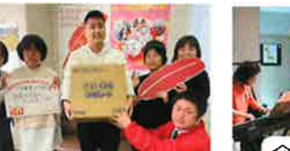
令和7年3月26日 奈良県共同募金会様より物品助成 ダイヤ製菓(株)様より冷却シート寄贈