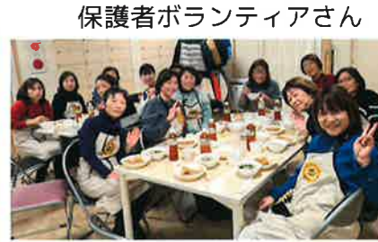
保護者ボランティアさん