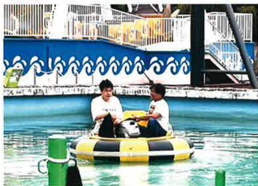
バンパーボートを楽しむ二人！

ドライブサファリやウォーキングサファリを楽しんだり遊園地を楽しんだりサイコーでした！