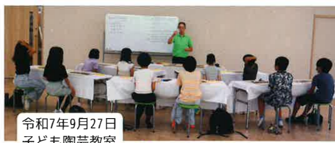
令和7年9月27日 子ども陶芸教室