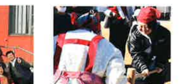
令和7年12月6日 鳥見地区自治連合会 餅つき体験会