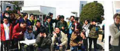
令和7年3月20日 いこまスポーツの日