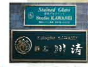
Japan Stained Glass Museum 日本ステンドグラス美術館 Studio KA/ASB 特別指導員 河原清氏